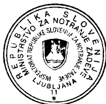
Vojko Kos INŠPEKTOR VIŠJI SVETNIK

Ta sklep je izdan po uradni dolžnosti in je takse prost po 22. členu ZUT.